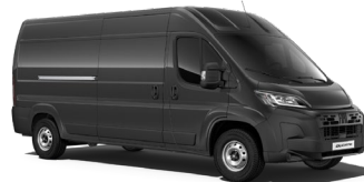
Nero Metallizzato (632) (metalliväri)