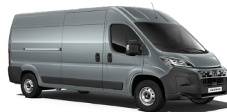
Grigio Lanzarote (385) (erikoispastelliväri)