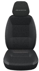
Tumma Crepe kangasverhoilu (076)