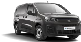
Platinum Grey (691) (metalliväri)