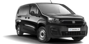
Metallic Black (632) (metalliväri)