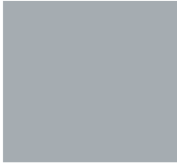
676 Expedition Grey